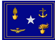
Ministero per la Difesa