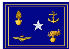
Ministero per la Difesa